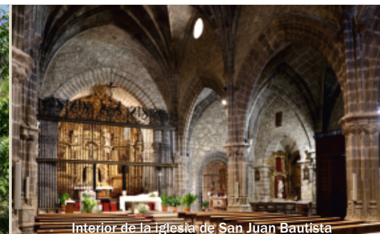
Interior de la iglesia de San Juan Bautista