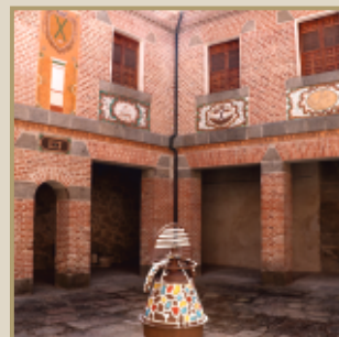
Patio del Hospital de San Andrés