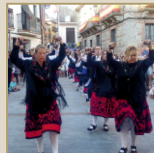
Mombeltrán conserva su folclore ancestral