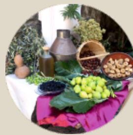
Productos serranos típicos de Mombeltrán

El rolo, símbolo de la justicia en la villa medieval, se levantó cuando Mombeltrán obtuvo el título de villazgo, en 1393. Está situado en la antigua entrada principal al municipio que arrancaba de la calzada romana.