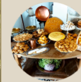
Dulces de Mombeltrán tradición centenaria