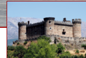
Castillo de Mombeltrán