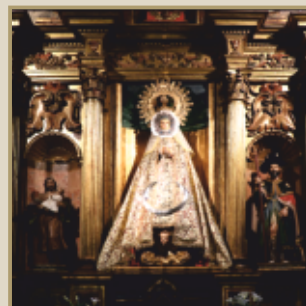
Ntra. Sra. de la Puebla, Patrona de Mombeltrán