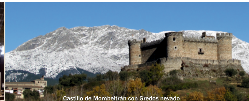
Castillo de Mombeltrán con Gredos nevado