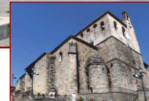
Iglesia de San Juan Bautista