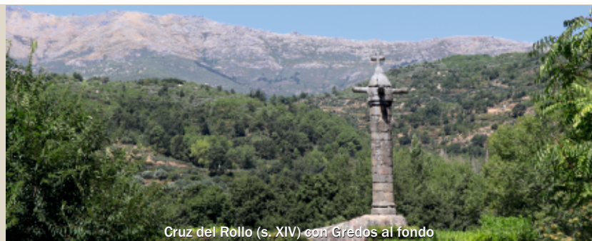
Cruz del Rollo (s. XIV) con Gredos al fondo