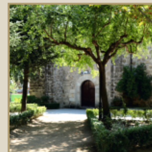
Parque y ermita de Ntra. Sra. de la Soledad