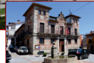
Ayuntamiento de Mombeltrán