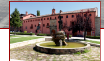
Hospital de San Andrés

El imponente Castillo de los Duques de Albuquerque se alza majestuoso ante las más altas cumbres del Sistema Central . Silencioso guardián del centenario paso del ganado trashumante y aventurados arrieros, que encontraron a su sombra la más eficiente manera de burlar la muralla granítica que es la Sierra de Gredos en su transitar entre ambas mesetas, como ya hicieron siglos antes los romanos.